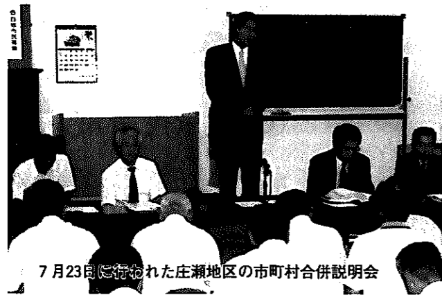
7月23日に行われた庄瀬地区の市町村合併説明会