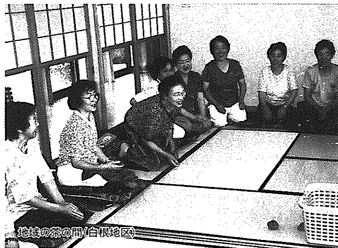
地域の茶の間(白根地区)

介護保険の調査などで、調査員が訪問させていただく場合があります。身分証明書を持参していますので、必要な場合はご確認ください。