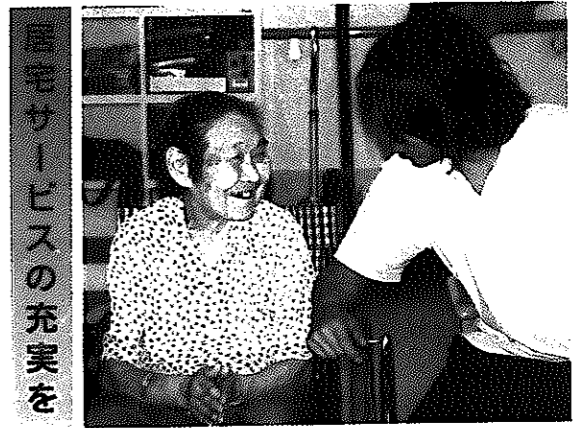
居宅サービスの充実を

市では、介護保険の運営に関し、いろいろな方面から意見を聞くため、医療・福祉・市民代表などで介護保険運営協議会を組織しました。 今回の計画の見直しに当たっては、三月および七月に委員会を開催し、平成十五年からの新しい計画について審議しています。 委員会では、「居宅サービスの充実を」といった要望や、「施設サービスの在り方」などについての意見が出ています。 今後は、市の高齢者福祉制度(紙おむつの支給や介護者見舞金の支給など)の施策や、介護保険料についても審議していきます。