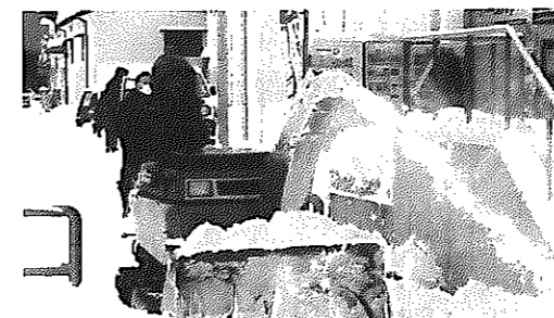
歩道除雪作業の様子。障害物は置かないようにしましょう

路上駐車は、除雪作業の障害になります。一台でも路上駐車があると、除雪車が前に進めなくなってしまう、その地域全体に迷惑が