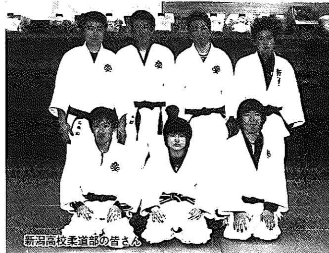
新潟高校柔道部の皆さん