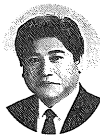
白根市長 竹内 正

明けましておめでとうございます。二十一世紀の幕開け、西暦二〇〇一年の新春にあたり、市民の皆さまのご健勝とご多幸をお祈り申し上げます。