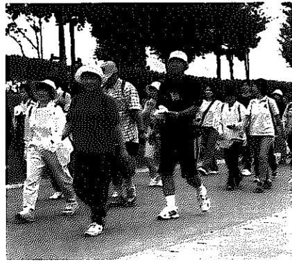
九月二十三日、カルチャーセンターと白根地区公民館主催の'00健康ウォーキング

ウォーキングで秋を楽しむ フェスティバル 「大勢で歩いたから、疲れませんでした」「子どもと一緒に秋の景色を楽しみました。ゴール後の豚汁がおいしかったです」などと、参加者たちは感想を聞かせてくれました。