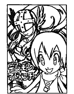
▲P-N怪盗ピンポンさん (徳波町)

■イラストは黒一色ではっきりと。ペンネーム希望の人も住所、氏名、年齢を忘れずに。採用分には粗品を進呈します。 【あて先】〒950-1292 白根市大字白根1235 白根市企画財政課秘書広報係