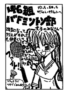
▲P-N青ちゃんさん (早月町/14歳)