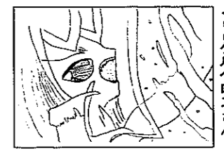
▲P-Nケルベロスさん (美咲町/11歳)

■イラストは黒一色ではっきりと。ペンネーム希望の人も住所、氏名、年齢を忘れずに。採用分には粗品を進呈します。 【あて先】〒950-1292 白根市大字白根1235 白根市企画財政課秘書広報係