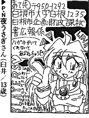
P.N.夜うさぎさん(白井/13歳)