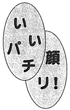
3/2 白根北中学校で世代間交流で