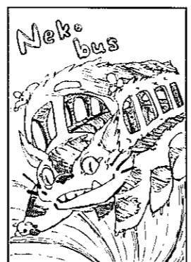
PNフエンスアイレスさん(大通南3)