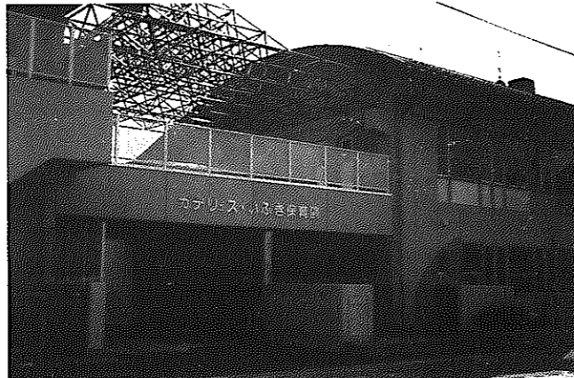
▲私立ガデュリスいぶき保育園に子育て支援センターと学童保育の運営を委託