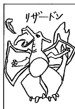
▶P.Nヒトカゲさん(庄瀬1/8歳)

【あて先】〒950-1292 白根市大字白根1235 白根市企画財政課秘書広報係