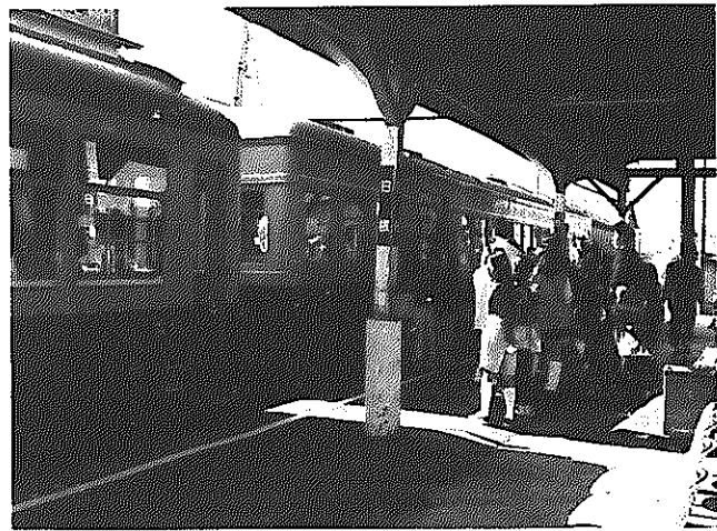
▲新潟交通電車線、4月早々に廃止

平成9年に新潟交通から赤字を理由に電鉄線の廃止申し入れがあつて以来、沿線で組織する存続対策協議会は粘り強く存続運動を展開してきました。しかし、交通側が廃止の方針を固持したため、昨年6月に廃止やむなしと判断。その後代替バスの運行や路線敷きなどの問題について協議を重ね、11月に条件を付して電車線廃止に同意しました。