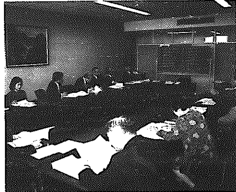
▲生涯学習センター名決定 平成12年春に完成予定の生涯学習センターの名称が「白根学習館（愛称ラスベック）」に決まりました。

平成9年に新潟交通から赤字を理由に電鉄線の廃止申し入れがあつて以来、沿線で組織する存続対策協議会は粘り強く存続運動を展開してきました。しかし、交通側が廃止の方針を固持したため、昨年6月に廃止やむなしと判断。その後代替バスの運行や路線敷きなどの問題について協議を重ね、11月に条件を付して電車線廃止に同意しました。