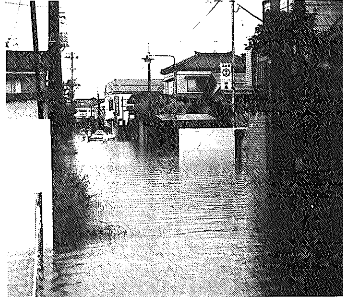
▲8月の集中豪雨、市内各地で被害

8月4日の集中豪雨では29戸が床上浸水、271戸が床下浸水に。12日に再び集中豪雨が襲い、15戸が床上浸水、140戸が床下浸水するなど市内各地に被害をもたらしました。