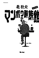
マンボウ族 北杜夫

新宿ゴールデン街の有名ママもトミーも、ほくが外国にいる間に危篤になった…。人生の出会いと別れをしみじみと描く傑作短編集。