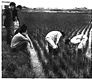
▲農業大学講座実習

市農業振興協議会では、これからの本市農業を担っていく若くは後継者の育成・確保を推進しています。 いったん会社に就職したが現在は就農している人、また近々就農したいと考えている人、高校を卒業して就農を考えている人には、就農時における営農技術の習得、農地の確保、資本整備条件を整備する就業支援制度があります。 また農業大学講座(稲作、花き・花木、果樹、野菜、畜産)を開講して、営農技術の習得や仲間づくりを図っていますので、詳しく知りたい方はお気軽にご相談ください。 ■問い合わせ 市役所農政課 農政係(☎233)