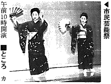
市民芸能祭の様子

本審査とは別審査で、書類審査、面接などがあります。 ■とき 11月15日(日) 午後1時30分～ ■ところ 新津市視聴覚センター ■審査 1次審査(書類審査とテープ審査。スピーチをテープに録音(5分程度)、申込書と一緒に9月19日(金)まで提出。20人を選出。2次審査(表現力、発音、審査員との対話などを審査。パフォーマンスマンも審査対象) ■表彰 各部門で最優秀賞1人、優秀賞3人を表彰 ■申込先・問い合わせ 青年教育センター ☎373・2800