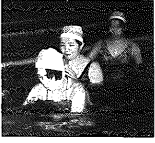
レディーズスイミングスクール

水泳の正しい知識、技術を身に付けてみませんか。女性対象です。 ■とき 9月25日(木)～10月23日(木)の毎週木曜日 5回コース 午前10時～11時30分 ■ところ ウエイブスイミングクラブ ■定員 30人 ■指導 市水泳協会 ■参加費 2,500円 ■申込期限 9月19日(金) ■申込先・問い合わせ カルチャーセンター 373・6311