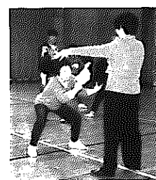
▲いきいき血管教室

介護の知識を身に付けてよう 家庭介護教室に 参加しませんか 高齢化社会を迎えて家庭でお年寄りを介護している人、今後のために介護の知識と技術を身に付けてみませんか。今年開設した特別養護老人ホームしなの園で開催します。ぜひ参加ください。 【とき】 10月5日(日) 午前9時30分~午後4時 【ところ】 特別養護老人ホームしなの園(庄瀬地区) 【内容】 ①しなの園施設見学・概要説明 ②お年寄りのかかりやすい病気とその対応 ③白根市で受けられる在宅福祉サービスと ④お年寄りの食事とさまざまな形態 ⑤基本的な介護技術とその実習 【定員】 先着50人 【参加費】 無料 【送迎】 当日午前9時、老人福祉センター前からバスが出ます。【申込期限】 9月30日(火) 【申込先・問い合わせ】 しなの園