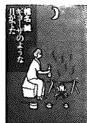
ギョーザのような月がた 椎名 誠