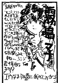
(水道町・12歳) P.N. 怒ンジさん