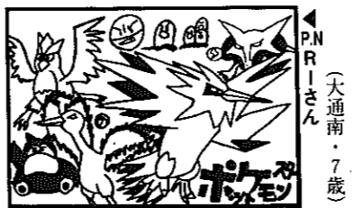
(天通南・7歳) P.N. Rーさん

◎イラストは黒一色ではっきりと ◎ペンネーム希望の人も住所、氏名、年齢を忘れずに。採用分には粗品を進呈。【あて先】〒950-12 白根市大字白根1235 白根市役所広報しろねイラスト係