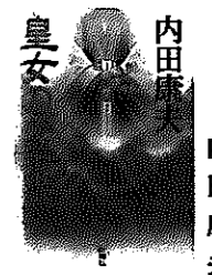
皇女の霊柩 内田康夫