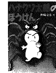
ハナクン太郎のぼうけん 舟崎克彦

●新着図書 ▶太陽王・武帝/伴野朗 ▶水迷宮汪の巻/長野まゆみ ▶羊ゲーム/本岡類 ▶夏の潮/山上竜彦 ▶竹の秋/吉田知子 ▶密入国ブローカー悪党人生/相川俊英 ▶神無き月十番目の夜/飯嶋和一 ▶嗤う伊右衛門/京極夏彦 ▶風の群像上・下/杉本苑子 ▶恩寵の谷/立松和平 ▶リトル、ビッグ1・2/ジョン・クロウリー ▶優しい殺し屋/ビル・フィッチュー ▶静寂の叫び/ジェフリー・ディーヴァー ▶かえるくんはかえるくん/マックス・ベルジュイス ▶ねむいよねむいよ/長新太 ▶ひびけ、チンドン/小沢良吉 ▶うみのひかり/土田義晴 ほかに多数