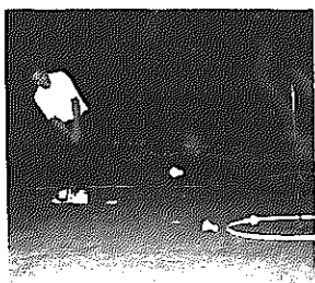
▲ターゲットボードゴルフ

手軽なニュースポーツとして人気のターゲットボードゴルフを、市体育指導委員の皆さんが教えます。 とき 8月21日(木)~9月18日(木)の毎週木曜日 5回コース 午後7時~9時 〇ところ 白根小グラウンド(雨天〇カルチャーセンター) 定員 30人 参加費 1,500円 申込期限 8月15日(金)までに参加費を添えて申し込み 申込先・問い合わせ カルチャーセンター ☎373-6311