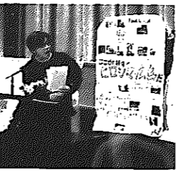
▲インターナショナルコンテスト

白根国際交流協会と新津国際交流協会では、英語スピーチコンテスト「インターナショナルコンテスト」を開催します。白根市、新津市、小須戸町、味方村、湯東村、中之口村に在住する中・高校生であればどなたでも参加できます。テーマは私の趣味、私の家族、将来の夢など何でもOK。ぜひチャレンジしてみてください。特別賞として①白根ホームステイ賞、②JIC(白根青年会議所)賞もあります。発表者の中から、①は白根市内在住者6~7人を、②はJICエリア(白根市、小須戸町、味方村、湯東村、中之口村)在住者1人を、経費の3分の2を助成して海外へ派遣します。ホームステイ先は春休みにアメリカを予定。本審査とは別審査で、書類審査、面接などがあります。●とき 11月15日(土) 午後1時30分～ ●ところ 新津市視聴覚センター ●審査 1次審査 書類審査とテープ審査