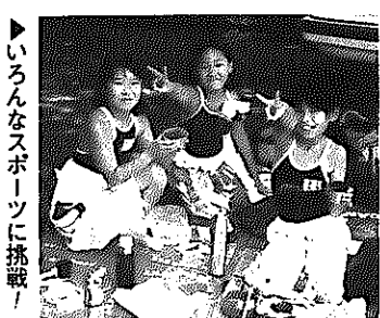
▶いろいろなスポーツに挑戦!

小学生のスポーツ教室。休みの1週間、みんないろいろなスポーツに挑戦しよう！ ■とき・内容 7月28日(日) スポーツテスト 7月29日(火) ゲートボール 7月30日(水) カヌー体験 7月31日(木) グラウンドゴルフ 8月1日(金) キックベースボール、終了後バーベキュー ■時間 午前9時30分~11時30分 ■ところ カルチャーセンターほか ■対象 市内小学3・4年生の男女50人 ■参加費 3,000円(保険代、バーベキュー代ほか) ■申込期間 7月7日(月)~23日(水)(先着順) ■申込先・問い合わせ カルチャーセンター ☎373-6311