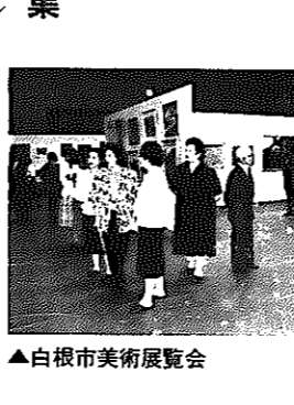
▲白根市美術展覧会

力作をお寄せください 白根市美術展覧会 作品募集 6月4日(水)～9日(月)にカルチャーセンターで開催される第25回白根市美術展覧会の出品作品を募集します。