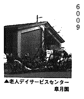
▲老人デイサービスセンター 阜月園