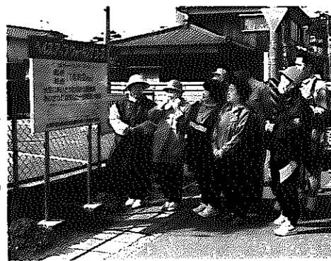
ウォーキングコースの説明を受ける参加者の皆さん

白根地区公民館主催の「ウォーキングコースを歩いてみよう」が、三月二十三日に行われました。同公民館では、四年前から地区内に四つのウォーキングコースを設け、昨秋までに全コースに起終点の立て看板を設置しました。この日、歩いたのは健生病院わきからカルチャーセンターを通る一周約二キロのコース。グループや親子連れなどで参加した二十八人が道ばたのツクシやフキノトウに目をやりながら、自分のペースに合わせて、のんびりとウォーキングを楽しみました。