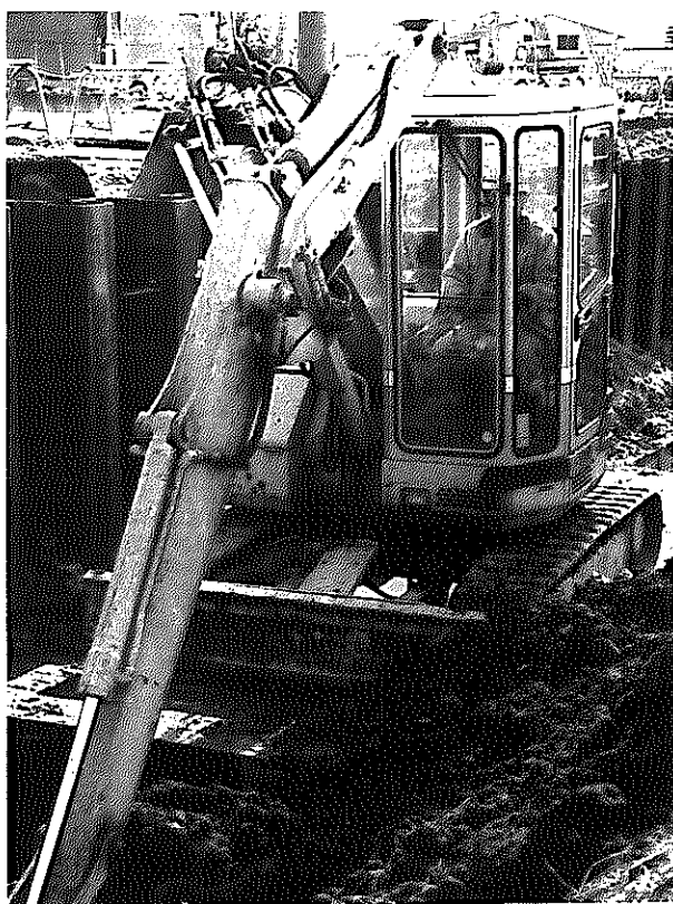
【公共下水道】 策定した基本計画をもとに都市計画決定の作業を進めていきます。新年度は、北部工業団地・大通南地内と、白根地区の七軒・鯉湯地内の事業認可を受け、処理場用地の測量や幹線管まよの地質調査に着手します。