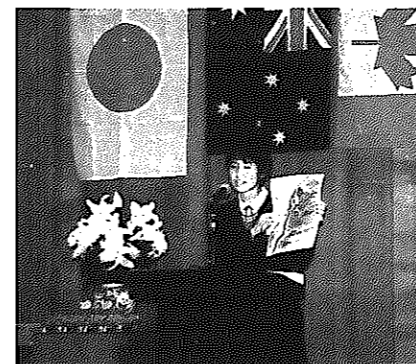
▲インターナショナルコンテスト

■とき 11月9日(土) 午後5時30分～ ■ところ しろね大凧と歴史の館 ■審査 1次審査=書類審査とテープ審査。スピーチをテープに録音、申込書と一緒に9月30日(月)まで提出。中学生、高校生でそれぞれ10人ずつを選出 2次審査=表現力、発音、審査員との対話力などを審査。パフォーマンスも審査対象。お祭り衣装などで大いにPRしてください ■表彰 各都府最優秀賞1人、優秀賞3人を表彰 ■申込先・問い合わせ 青年教育センター ☎373・2800