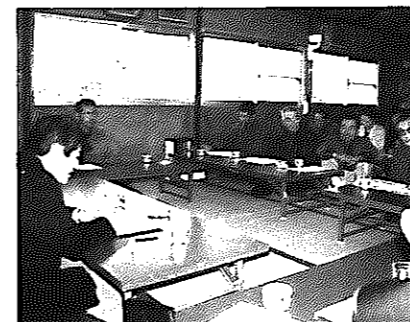
▲七軒以北連絡協議会の皆さんとの談・談・トーク

まちづくりには皆さんの声が必要です。この白根を夢いっぱい大地にするために市長と語り合ってみませんか。■申込方法 はがきまたは電話で、グループ・団体名、対話テーマ、参加予定人数、開催場所、開催希望日、代表者名、連絡先を企画財政課広報広聴係へ連絡 ■開催日 申し込み受付後、調整して決定します ■その他 会場の設営、集会の運営などは開催団体で行ってください ■申込先・問い合わせ 市役所企画財政課広報広聴係(白根市大字白根1235 ☎332、333)