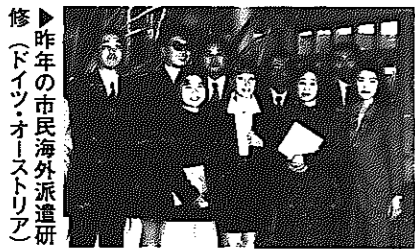
修▶昨年の市民海外派遣研修(下イソノオーストリア)

■とき 10月27日(日)～11月3日(日) ■対象者 一年以上白根市に住んでいる20歳以上の人で、健康で積極的に行動ができる人 ■募集人員 10人を予定 ■個人負担 20万円程度 ■問い合わせ 市役所企画財政課地域振興係(☎328)