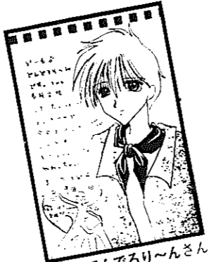
▲P.N でんでろり〜んさん (七軒町)