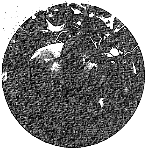
第四次白根市総合計画