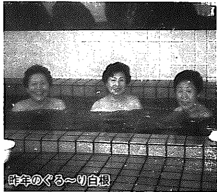
白根のぐるり～白根

■とき 11月9日(木) 午前9時～午後4時 ■集合 市役所市民ホール ■参加費 1,500円 ■コース 衛生センターグリーンタワー、「団四郎みそ」のみそ蔵(新飯田)、地酒「さか鶴」の酒蔵(新飯田横山酒造)、白根温泉(昼食・入浴・助役との懇談会)ほか ■申込先・問い合わせ 11月6日(月)までに市役所企画財政課広報係(☎332)へ