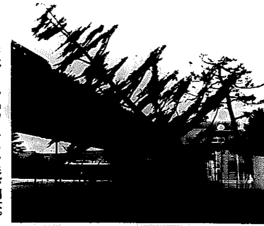
白根小プールの脇のヒマラヤ杉が倒木。自転車小屋を破壊した。

竜巻が発生したのは、十二月七日の午後三時ころ。五六の町付近から白根小学校を経て、国道8号に至る道筋を通過しました。白根小学校のヒマラヤ杉の太木が倒されたほか、民家の塀が壊れたり戸やガラスが吹き飛んだり、各地で被害が発生。市内の被害総額は二百五十万円となりました。通り道に当たった住民は「最初は突風だと思った。ものすごい揺れ方と音で、とてもこわかった」と話していました。