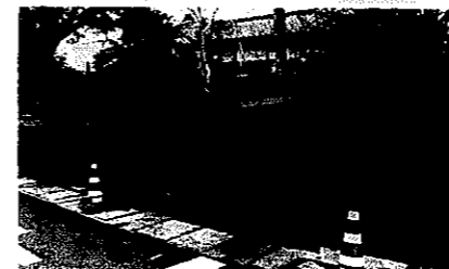
通り道では民家の塀が壊された。

12月7日午後、竜巻が発生し本市の中心部を通過。民家の戸が飛ばされ、塀や垣根が壊れるなど、各地に被害をもたらしました。