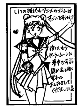
▲P.N ジャンパーソンさん(白根)