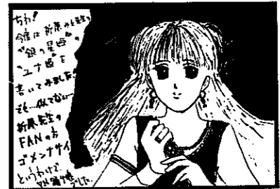
▲PN 踊り娘さん(大通南・13歳)

★イラストは、はがきに黒一色ではっきりと。薄い鉛筆書きはボツにします ◆ペンネーム希望の人も住所、氏名、年齢は忘れずに ♥締め切りは毎月15日です。それ以降に届いたものは翌月に回します ◆あて先は 〒950-12 白根市大字白根 白根市役所 広報イラスト係へ ◆採用分には粗品を差し上げます