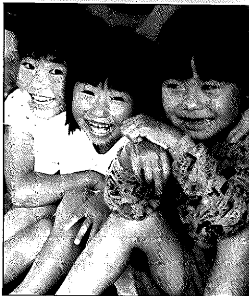
7月15日、古川保育園で

お出かけください 青少年健全育成大会 8月20日(金) 13時30分〜 30分 回カルチャセンター などをたても 少年の主張発表、健全育成成功者の表彰、記念講演など 青年教育センター(373・2800)へ 日本のデザイン展 デザイン状況展 生活商品デザインナー9人の作品展 8月26日(木)〜30日(月) 新潟伊勢丹7階 アートホール デザインシンポジウム デザイン展参加デザイナーの講演とパネルディスカッション 8月26日(木) 13時30分〜16時30分 ホテル新潟2階 芙蓉の間 入館者 公開実験「マグネットショー」 8月31日(火)まで ①11時40分 ②13時40分 回館エントランスホール 入館者 ②以上、同館(新潟市女池 283・3331)へ プール一般開放 8月8日(日)・22日(日) 10時〜15時 回池田スイミングクラブ 料金 小学生以下150円、中学生以上300円 スイミングキャップを必ず着用すること 白根水泳協会事務局(池田スイミングクラブ内 373・4646)へ 県立自然科学館 特別展「光のファンタジーワールド」 光と音が織りなす幻想の世界をお楽しみください 8月31日(火)まで 回同館特別展示場 入館者 公開実験「マグネットショー」 8月31日(火)まで ①11時40分 ②13時40分 回館エントランスホール 入館者 ②以上、同館(新潟市女池 283・3331)へ