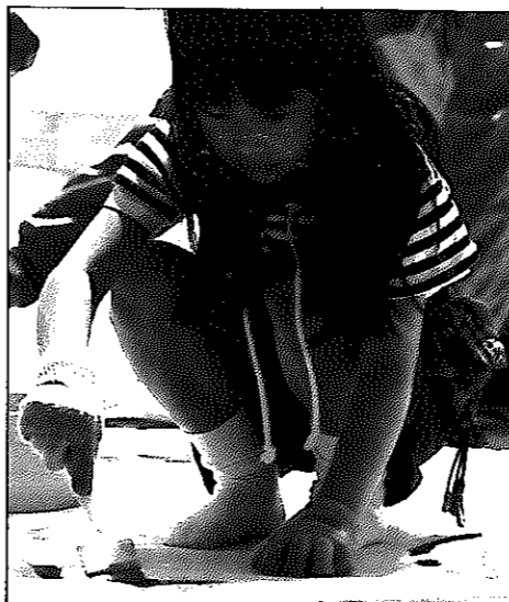
5月16日、白根小学校グラウンドで