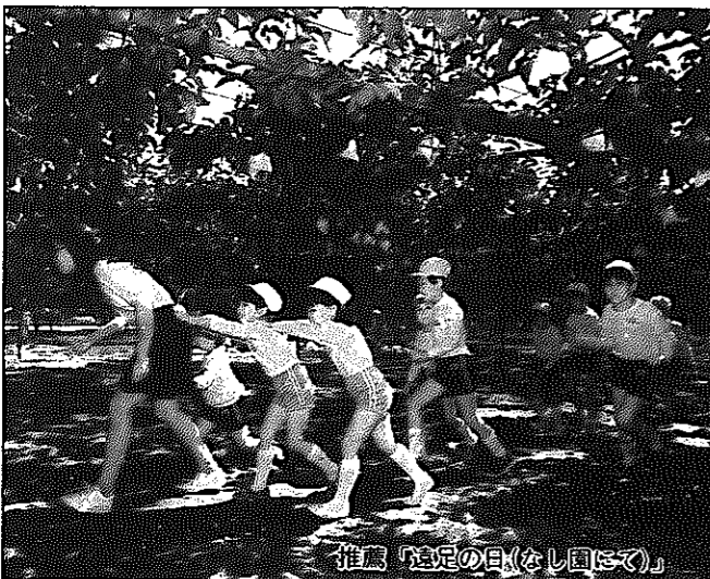
推薦「遠足の日(なし園にて)」