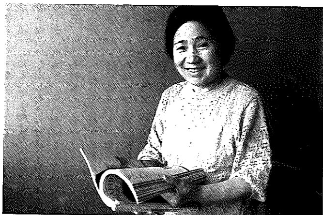
広報しろねは資源保護のため再生紙を使用しています