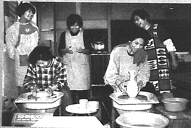
広報しろねは資源保護のため再生紙を使用しています。