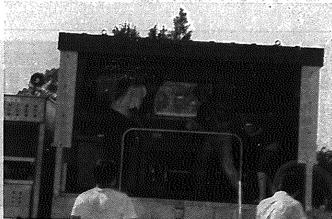
広報しろねは資源保護のため再生紙を使用しています。