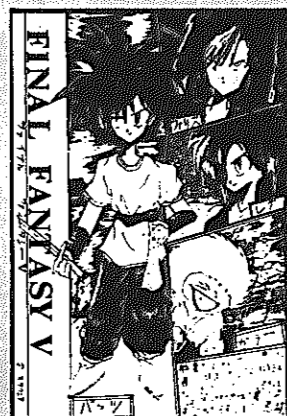
▲P.N. きくいちもんじさん(白井・13歳)