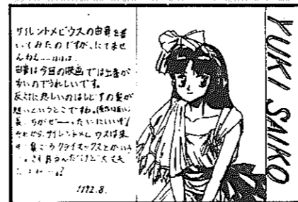
▲P.N. 鷹のデュランさん(白井・14歳)