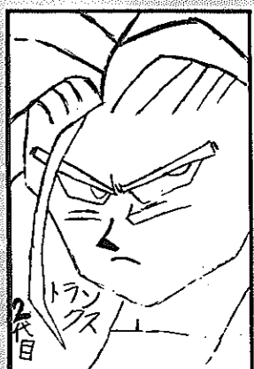
▲P.N. モンモンさん(高井東・12歳)