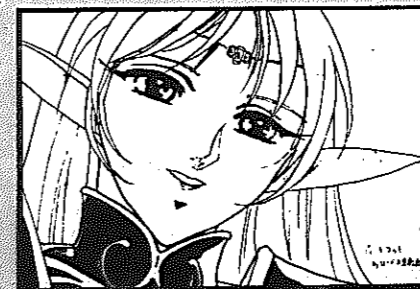
▲P.N. 月野たぬきさん(白根・15+5歳)