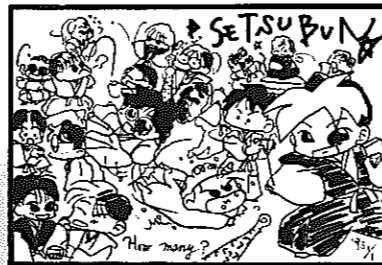
▲ペンネーム 写 菜さん(新飯田)