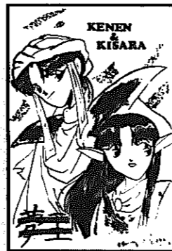
▲ペンネーム ボツ太郎さん(鵜湯1丁目)