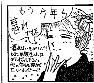
▲ペンネーム ニセYUSYAさん(赤坂)

□固定資産税、都市計画税(各4期)、国民健康保険税(7期) 固定資産税と都市計画税の納付書は既に発送済み。国民健康保険税の納付書は12月中旬に発送します。納期限は1月6日(月)、忘れずに納めましょう。