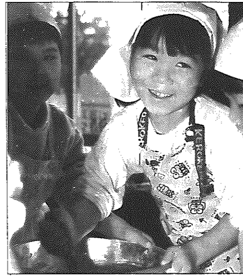
11月18日、白井保育園で