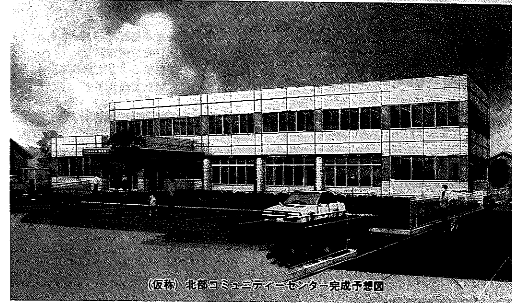
(仮称)北部コミュニティーセンター完成予想図