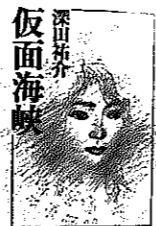
仮面海峽 深田 祐介

父の急死で会社を継いだ正明は、ある夜韓国女性の訪問を受けた。父が生前取引をしていた韓国の会社を代表して来たと言う。トラブル解消のため、韓国に飛んだ正明を待っていたものは……。表題作を含む五編を収めた短編集。