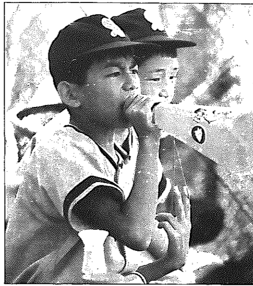
8月12日、少年野球大会で