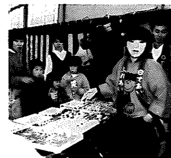
▲ヤングフェスティバル

青年スクール □5月15日～12月11日の毎週水曜日 午後7時30分～9時30分 □青年教育センター 市内に在住・在勤の青年 □趣味や学習を通じた仲間づくり。5講座を開講 □コース学習 □3回、希望コースで腕をみがきます ▽合同学習 □月1回、全コースの受講生が一緒になって一般教養、レクリエーションなどで友情を深めます。 青年球技大会 □6月中旬 □学校施設ほか □市内の勤労青年 □軟式野球、バレーボールなど 下越青年大会 □7月下旬 □北