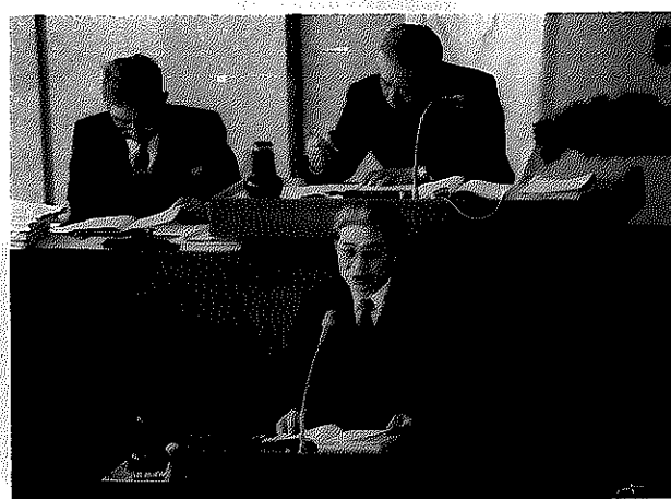
施政方針を説明する滝沢市長

三月七日、平成三年第一回市議会定例会が招集されました。滝沢市長は施政方針演説の中で「近年にない大規模事業を進めており、引き続き厳しい財政状況におかれているが、二十一世紀に向けたまちづくりを目指し、市民の幸せと本市の発展のため、より一層の努力を続けていきたい」と決意を述べ、市民の皆さん