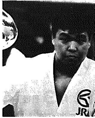
おがわ・なおや (22歳・JRA日本中央競馬会) '89ベオグラード世界柔道選手権無差別級、95kg超級優勝。'89・'90全日本柔道選手権優勝。

市制施行30周年とカルチャーセンター柔道場の落成を記念して、柔道の無差別級世界チャンピオン、小川直也選手を迎え、模範演技と講演会を開催します。入場は無料で、どなたでも自由に入場できます。お気軽においでください。