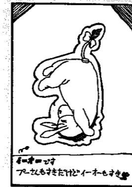
▲ペンネーム ブーさん大好き♡さん(白井・12歳)