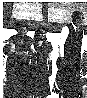
「笑点」に 市長も飛び入り出演