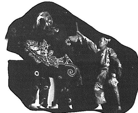
記念式典オープニングは白根神楽舞