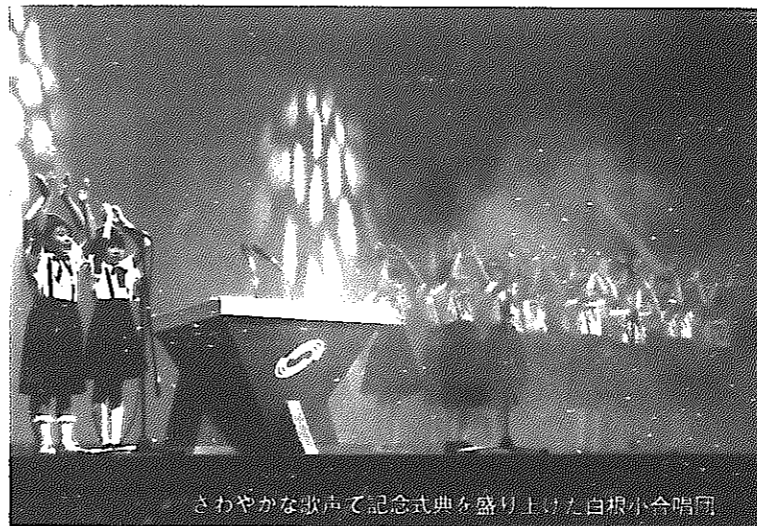
さわやかな歌声で記念式典を盛り上げた白根小合唱団