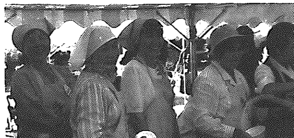
私たちが「ファミリーランド」で市民のつどいに参加しました