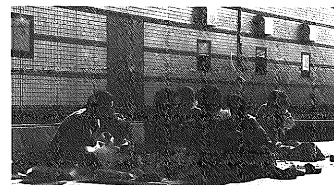
「笑点」の公開放送を見ようと一番乗りのグループ 午前4時30分にはカルチャーセンターに到着!