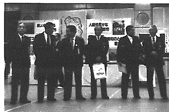
金子県知事をはじめとする来賓の方々