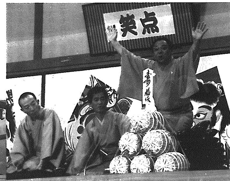
「笑点」大喜利 こん平師匠座布団10枚獲得