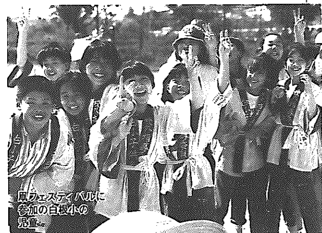
風物祭に 参加の白根小の児童

会場に入つてまず広さにびっくりしました。式典では、あまりの素晴らしいさにごときしつばなし、こういう式典は初めてでしたから、白根を改めて見直しました。